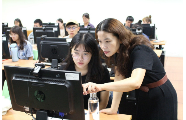
講者指導參與者操作

10.活動檢討：(本項活動如與計畫績效指標有關，請說明是否達成；如未達成，請說明原因) 無。