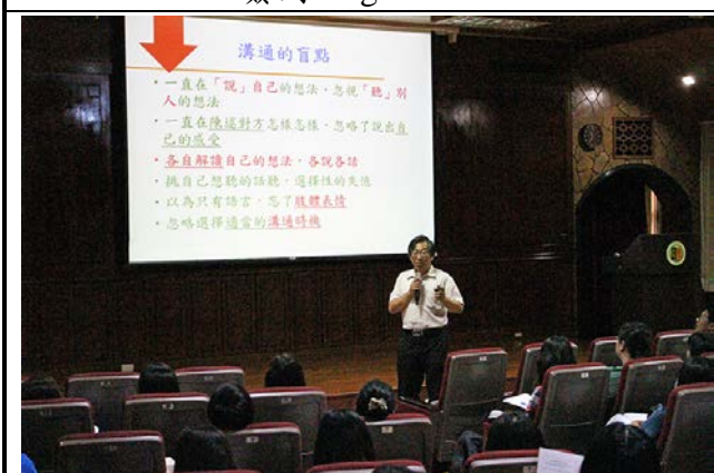
演講二 Speech II