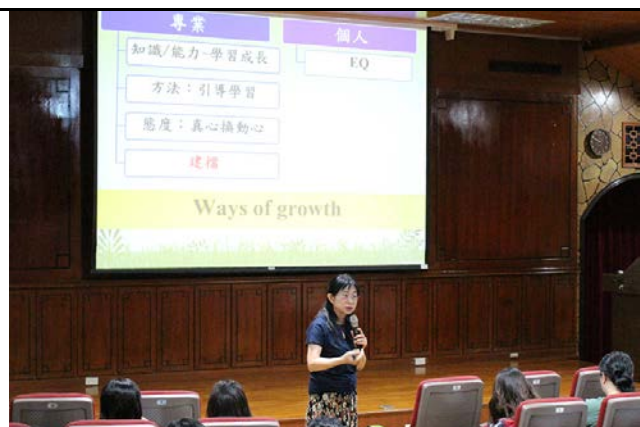
演講一 Speech I