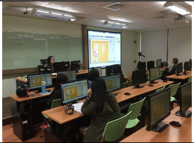
參與者認真聽講 Participants were engaged in listening to the lecture.