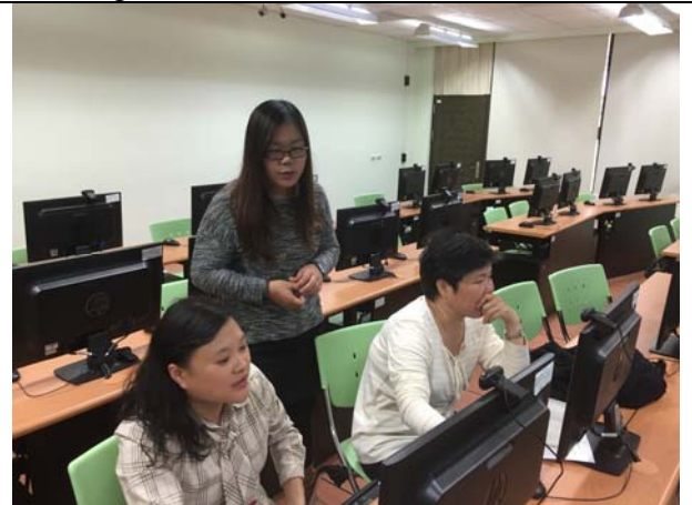
參與者實際操作系統 Participants were involved in hands-on operations.

10.活動檢討：(本項活動如與計畫績效指標有關，請說明是否達成；如未達成，請說明原因)