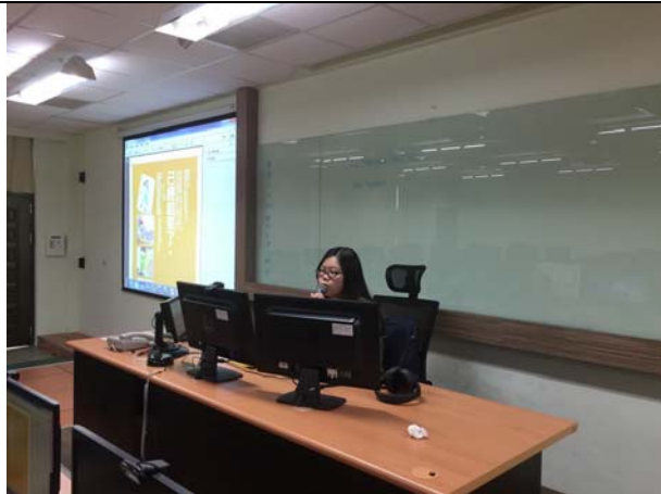
講師講述如何使用 EverCam Point。The lecturer taught how to use EverCam Point.